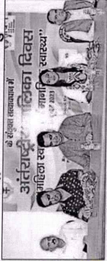
के संयुक्त तत्वावधान में

राहर के शिक्षण संस्थानों में अंतरराष्ट्रीय बालिका दिवस पर हुए कार्यक्रम, एमआईटी में कार्यशाला में किया मंथन माई सिटी रिपोर्टर